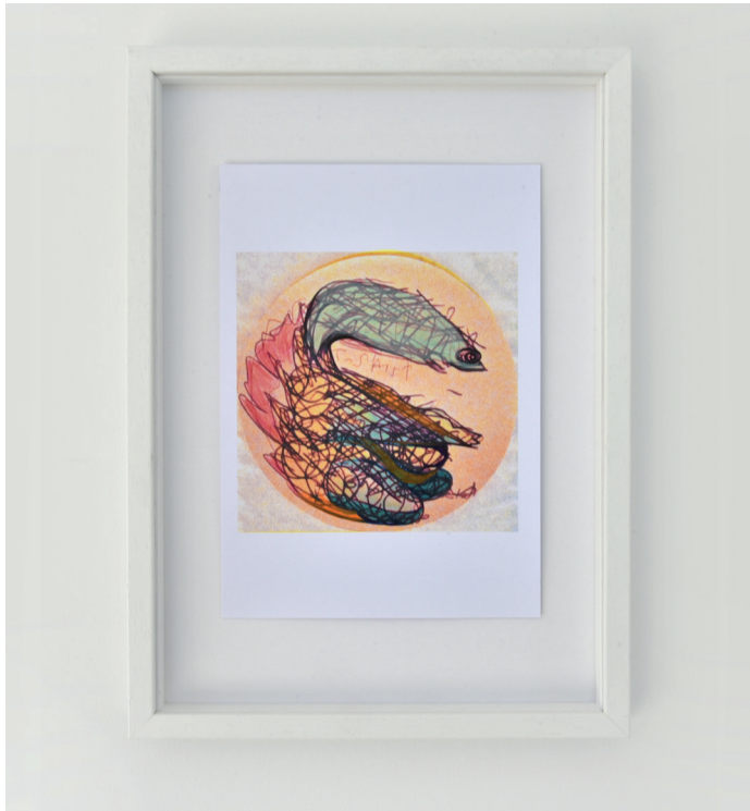
Pages précédentes et ci-dessus : Ensemble d'impressions rehaussées sur papier, 2020, techniques mixtes, 21 x 14,8 cm.